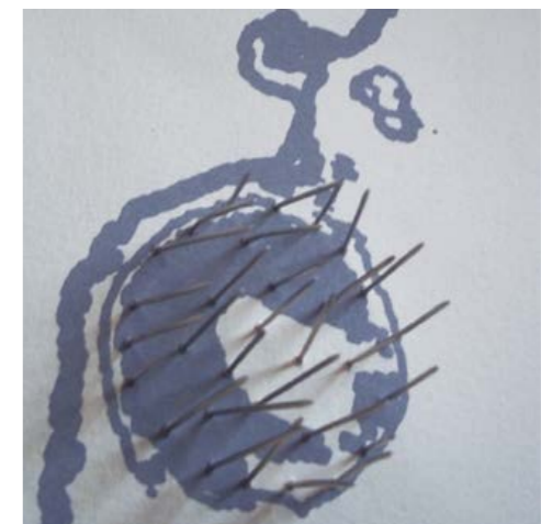
1- Serie Flayed identity (Despellejada) , 2013 Flayed identity I (Identidad desollada) Impresión con tintas de pigmento mineral 71,5 x 100 cm