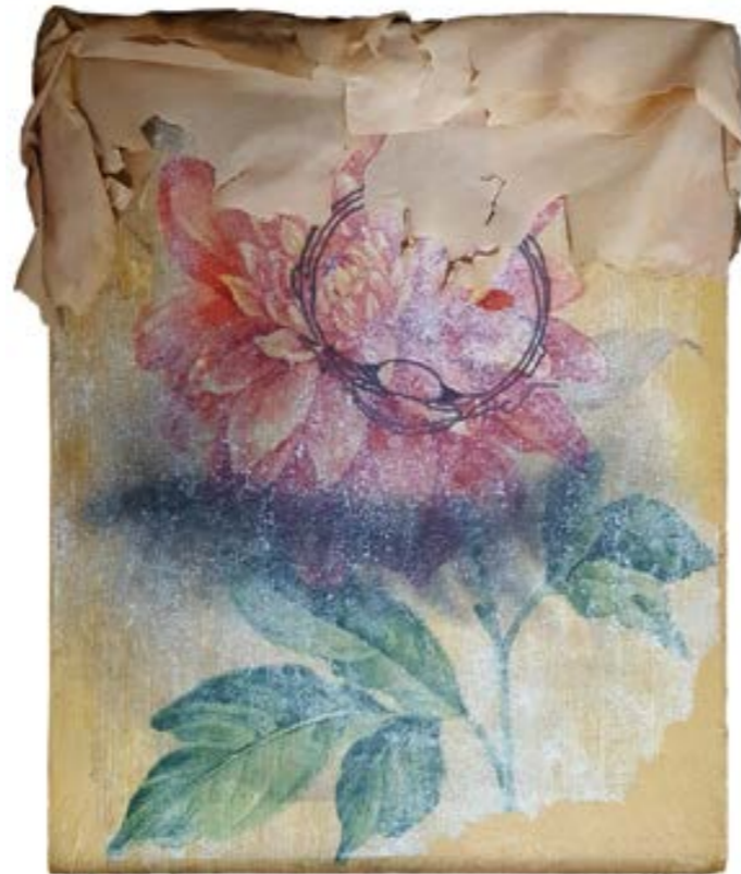
Eliás, diseño gráfico - D.L. ASXXXXXXX