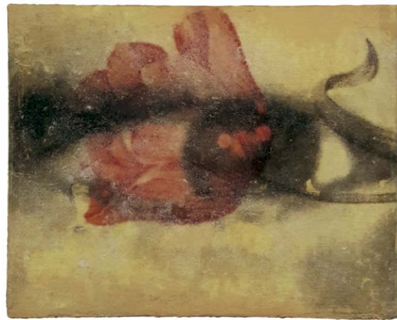
Serie Proyecto Especifico de Identidad (PEI) , 2015-2016 Parpa-deus (diptico) , 2016 Técnica mixta 13,5 x 16,5 cm y 20 x 18 x 3,5 cm