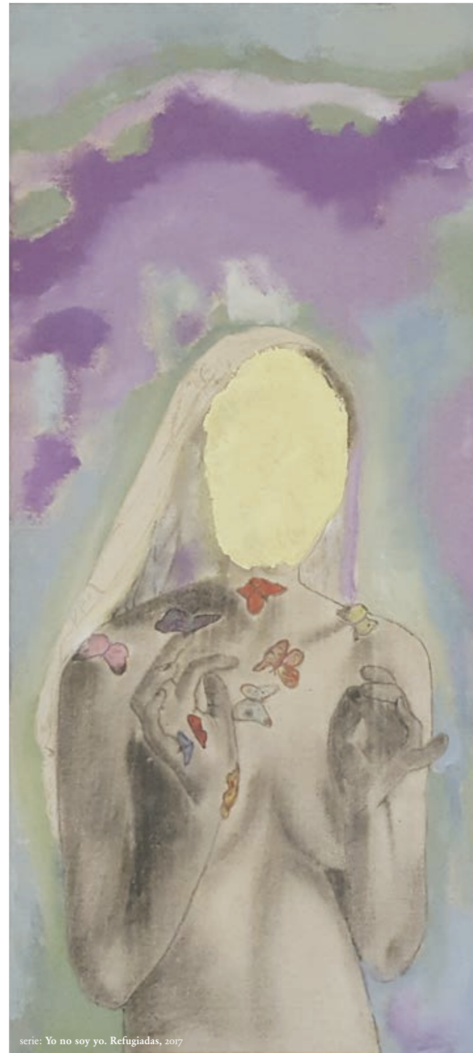
serie: Yo no soy yo. Refugiadas , 2017

horario: lunes a viernes de 09:00 a 14:00 y de 17:00 a 21:00 horas sábados, domingos y festivos cerrado